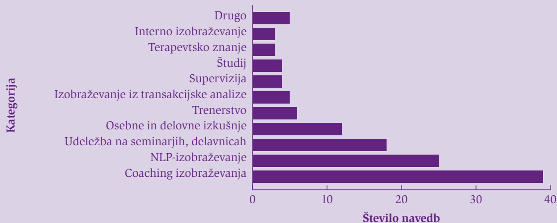
Graf: Strokovna usposobljenost slovenskih coachev